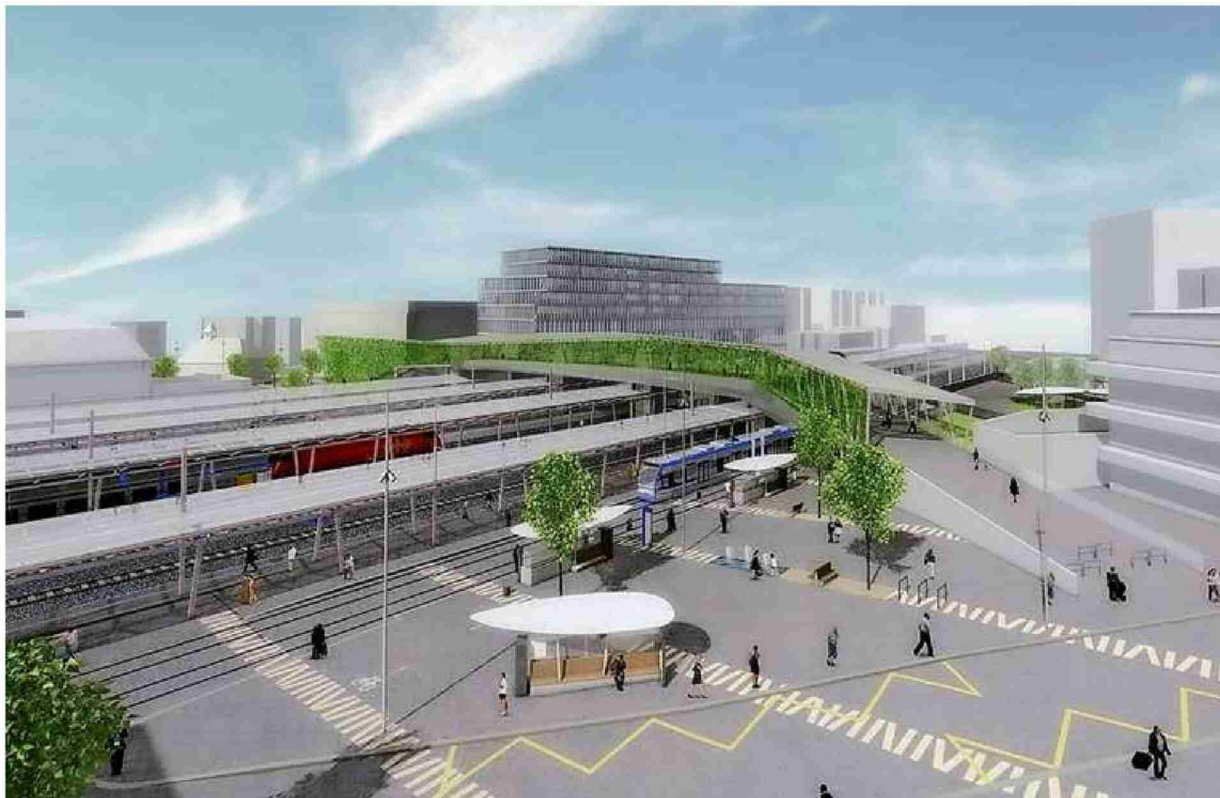
Le tram, s'il est construit, rejoindra la place nord de la gare de Renens, sous la passerelle Rayon vert.

Les TL devront notamment se charger de détruire deux bâtiments du bord des voies: l'ancien bistrot Le Terminus et un autre édifice adjacent. Cindy Mendicino