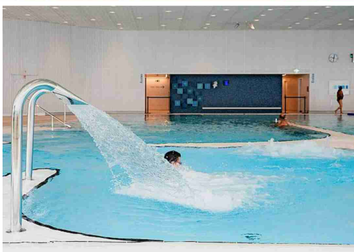
Un bassin dédié à la détente avec des jeux d'eau.