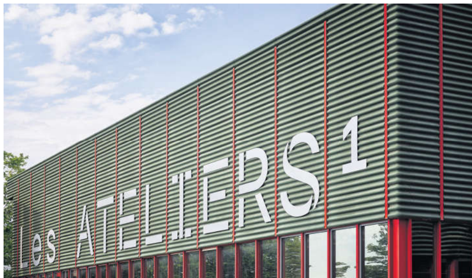
Ateliers de Renens

(ECAL) – installée depuis 2008 dans le bâtiment de l'ancienne usine textile IRIL – ou encore celle de services cantonaux et fédéraux tels que tribunal, Service de protection de la jeunesse ou centre de formation (IFFP) sur l'ancienne friche de Longemalle. Le passé industriel de la ville n'est jamais bien loin, qu'il continue d'offrir des places de travail ou qu'il fournisse les infrastructures de base aux nouveaux acteurs et actrices de la vie économique.