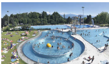
Piscine de Renens

De nouvelles infrastructures, un engagement fort pour l'environnement, la vitalité de son économie et la pérennité de ses places de travail, un statut de chef-lieu de district, tous ces éléments créent le cadre de vie concret des Renanaises et des Renanais. La Ville se distingue par de nombreuses rencontres destinées aux nouveaux habitants-e-s, aux aîné-e-s, aux familles et aux communautés étrangères, par un milieu associatif riche ou encore