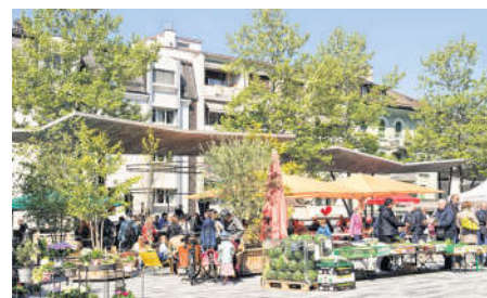
Marché de Renens

village agricole vers 1850 s'est transformé en centre ferroviaire, puis en ville qui a su assimiler des phénomènes d'industrialisation et de désindustrialisation, et finalement repenser l'entier de sa place économique tout en préparant la transition écologique.