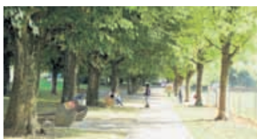
L'allée de platanes bordant le terrain de Verdeaux

En face du Temple de Renens, vous entrez dans le parc public pour vous rendre à la volière où vous pourrez admirer plusieurs espèces d'oiseaux. Ensuite, une magnifique allée de platanes bordant le terrain de foot de Verdeaux vous permet d'atteindre le Bugnon. Là se trouve un kiosque pour faire quelques emplettes.