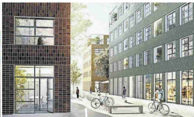
Les bâtiments de la partie ouest du quartier auront un petit air industriel.