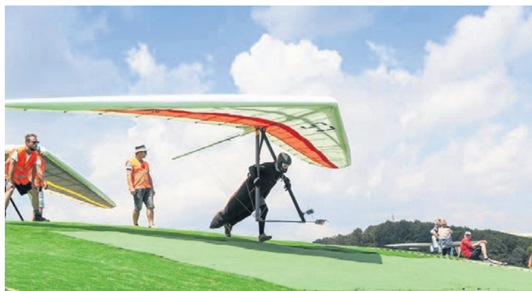
Décollage lors du Championnat d'Europe à Krushevo, Macédoine

Hobbies à part le deltaplane: cirque, escalade, parapente, vélo.