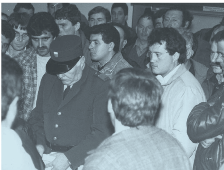
Contrôle des passeports par un garde-frontière, mars 1989

Très significatif et parfois employé à tort, le vocabulaire migrant comprend l'ensemble des processus migratoires, soit les «immigrés» du point de vue du pays d'accueil et les «émigrés» du point de vue de celui d'origine. Est donc considérée comme migrante toute personne vivant en dehors de son pays d'origine ou de naissance. →