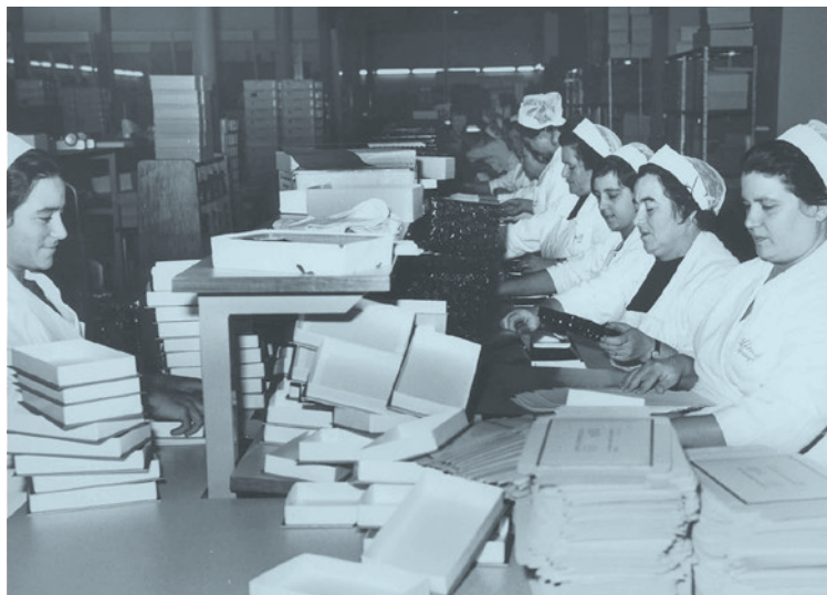
Travailleuses d'une fabrique de chocolat emballant des pralinés