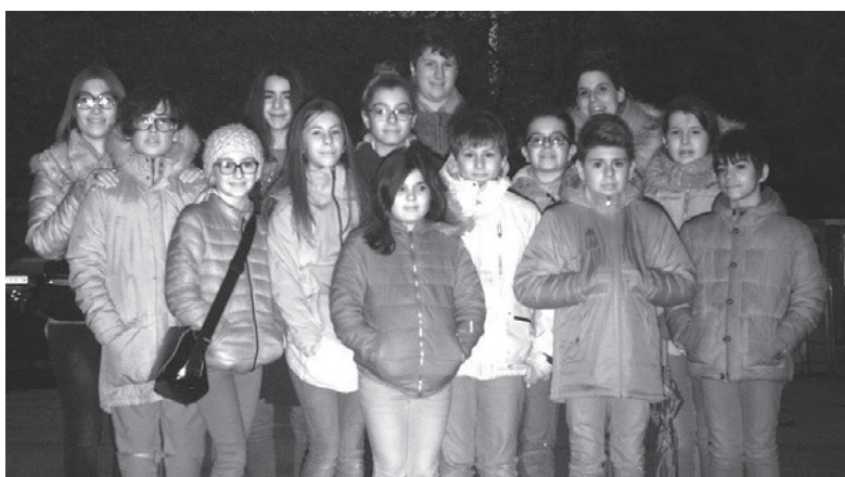
Après la photo de groupe prise par un radar fixe, les participants ont terminé cette journée par un goûter à la cafétéria de la caserne des pompiers de Renens

La Ville remercie chaleureusement la POL pour son accueil! •