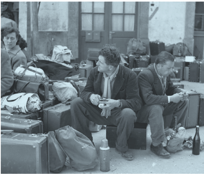
Travailleuses et travailleurs à leur arrivée en gare de Brigue, 1956

→ Que dire du terme «sans-papiers», abondamment employé aujourd'hui ? La personne sans-papiers est de nationalité étrangère et n'a pas de statut légal: soit parce qu'elle n'a pas requis d'autorisation de séjour ou ne l'a pas obtenue, soit parce qu'elle l'a perdue, à la suite, par exemple, d'une non-reconnaissance de ses motifs d'asile, d'un divorce, etc.