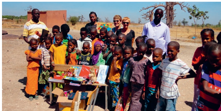
Les élèves et les enseignants de l'école de Keur Mbaye Danayel avec les membres de l'association «Des racines et des hommes»