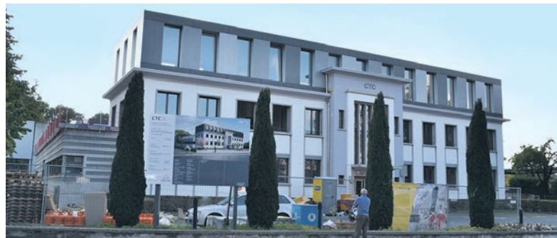
Le Centre Technique Communal rehaussé d'un étage

Compte tenu des enjeux financiers importants à venir, la Municipalité maintient sa gestion rigoureuse du budget tout en améliorant ses infrastructures et en consolidant les prestations actuelles. ●