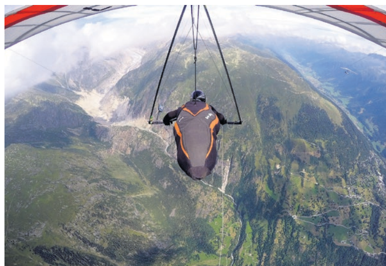
En vol, au départ de Fiesch

DZ: C'est dur à dire, j'ai tellement de beaux souvenirs. Je garde en tête un vol mémorable de plus de 6h depuis Fiesch (dans le haut Valais). Un vol magique au-dessus des glaciers et des sommets avec mon record d'altitude à plus de 4'800m. Le sentiment de liberté est juste magique et survoler les plus hauts sommets suisses tout simplement grandiose!