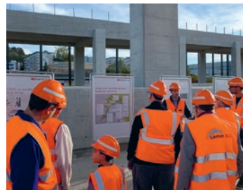
Toutes les générations étaient présentes sur le chantier du viaduc ferroviaire

Quelque 600 personnes se sont déplacées le 12 octobre dernier lors des visites du chantier du saut-de-mouton entre Prilly-Malley et Renens. Il leur a été proposé de se rendre à l'intérieur de ce colossal ouvrage en construction et d'échanger avec les responsables du projet. Le viaduc permettra aux trains de passer par-dessus d'autres voies et améliorera la fluidité du trafic ferroviaire. ●