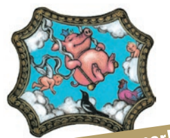
Un Opéra dans le Potager © Tom Tirabosco

Entrées: Plein tarif 25.- | Réduit 20.- | Jeunes 10.-