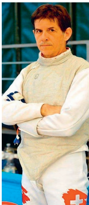
Concentration avant le combat

Démonstration de fleuret lors de la cérémonie des Mérites