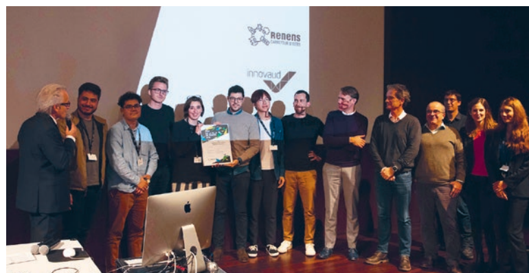
Remise du Prix du Jury aux projets «Nebulo-System» et «Pneumoscope»

La 3 e édition de ce challenge, qui a pour but d'initier des collaborations entre entreprises et designers de la région, s'est tenue le 19 novembre dans le cadre de la Semaine entrepreneuriale.