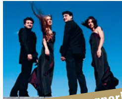
Quatuor Byron

Entrées: Plein tarif 25.- | Réduit 20.- | Jeunes 10.-