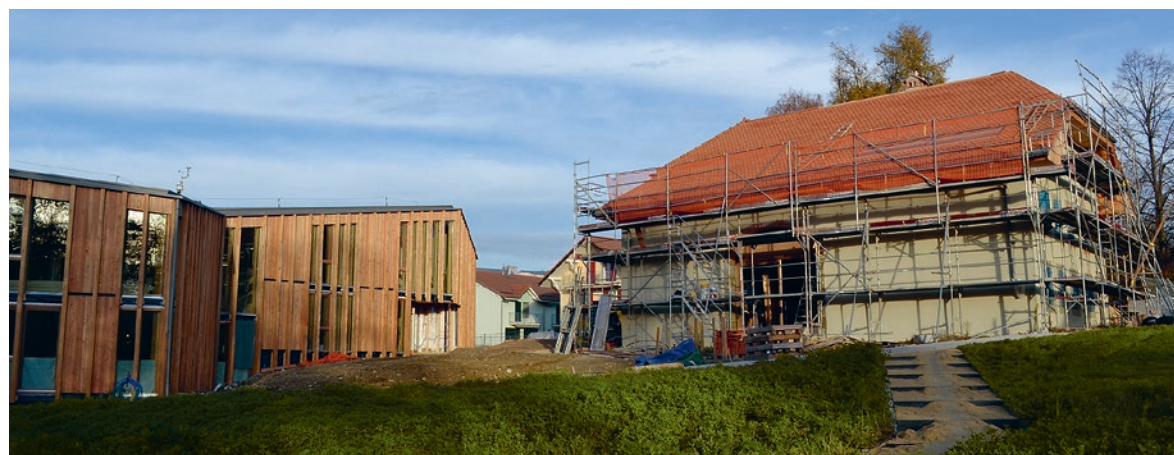
41 nouvelles places d'accueil collectif de jour sont prévues sur le site de Château 17, actuellement en chantier.

Compte tenu des enjeux financiers importants à venir, la Municipalité a suivi pour 2020 sa politique rigoureuse d'élaboration du budget communal en veillant à contenir dans la mesure du possible l'augmentation des charges communales, tout en maintenant et en garantissant la qualité des prestations proposées à la population. ●