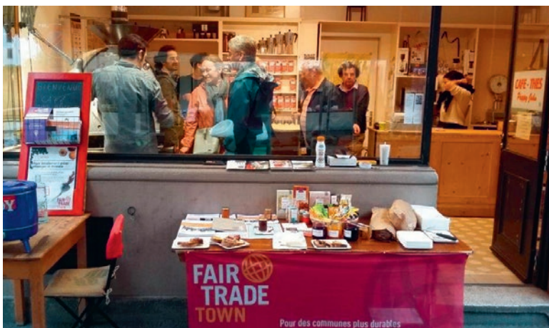
Dégustation de café issu du commerce équitable en mai dernier chez le torréfacteur Pappy John à Renens, un des commerces locaux participant à la démarche Fair Trade Town. Voir également p.6