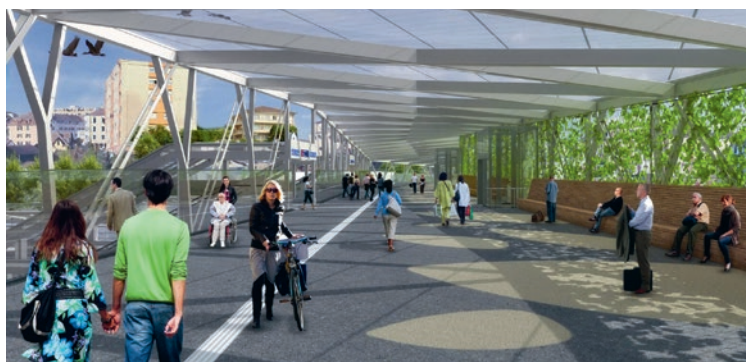
Image virtuelle de la passerelle Rayon Vert lorsqu'elle sera complètement terminée.

Les travaux se poursuivront encore durant une année, avec l'équipement de la passerelle et l'aménagement des places nord et sud de la gare. La mise en service est prévue pour fin 2020. ●