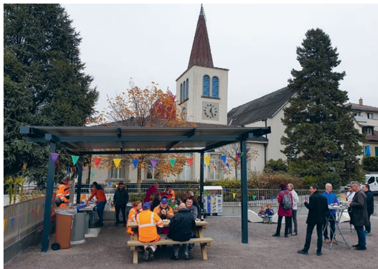
Les nouveaux aménagements de l'esplanade ont été inaugurés le 30 octobre dernier, lors d'une grillade conviviale, offerte par la Ville

Faites donc une halte sur l'esplanade du 24-Janvier. On y trouve un fitness urbain et une table de ping-pong pour les sportifs, un grill électrique pour les amateurs de grillades (seulement à la belle saison), des transats, banc, couvert et tables de pique-nique pour le doux farniente en plein air et un carré potager pour les jardiniers en herbe. ●