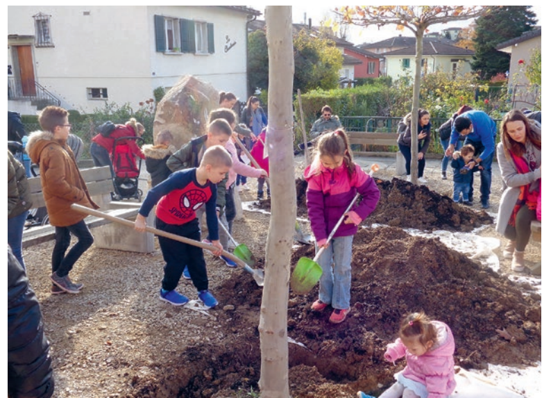
Le 13 novembre à Sous-Biondes, la plantation s'est faite avec la participation active des familles d'enfants nés en 2018, des membres de l'Association Jardins de quartier et de tous les habitants intéressés.

Ce sont donc deux platanes parasol qui offriront bientôt leur ombre bienvenue aux petits et aux grands, et qui rendront hommage à la jeune génération. •