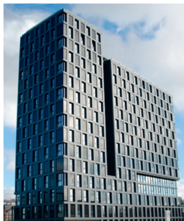
La façade sud-ouest du Silo bleu © Epure Architecture et Urbanisme SA

Grâce à ce dispositif, ce bâtiment produit plus de 90% de sa consommation. Ce résultat est obtenu grâce à la disposition des panneaux sur les quatre façades. •