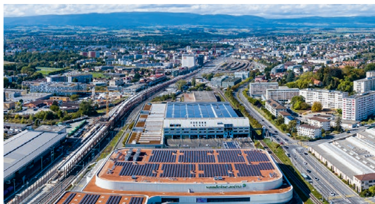
Vue du ciel du chantier du saut-de-mouton. Long de 1'175 m, le viaduc affiche une hauteur de 9 m à son point culminant. Les travaux ont débuté en novembre 2018 et prendront fin en décembre 2021. Le coût de ce projet, qui fait partie du programme Léman 2030 des CFF, s'élève à 112 millions de francs