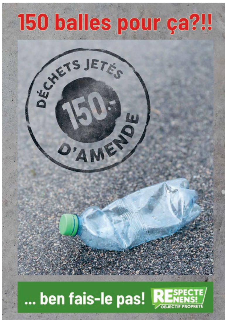
Plus d'infos sur www.renens.ch .