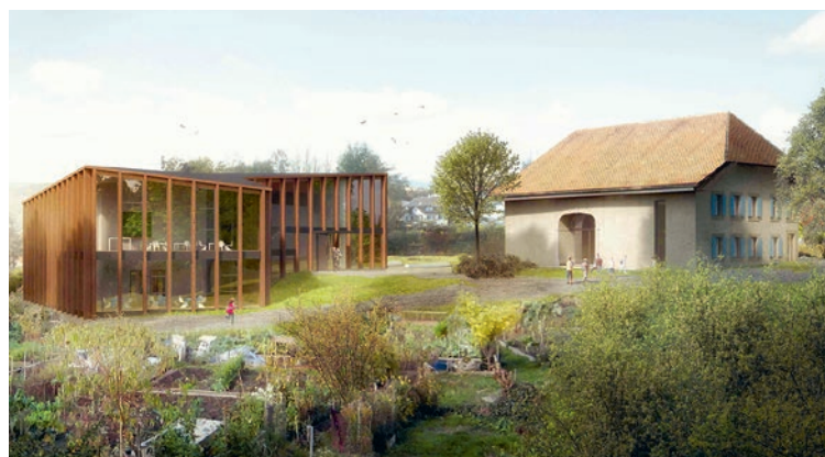
Château 17: image de synthèse du projet Gary © Atelierpulver architectes