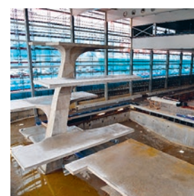
Le plongoir de la future piscine

rendez-vous sur la page Facebook Centre sportif de Malley ou sur les webcams de www.espacemalley.ch . •