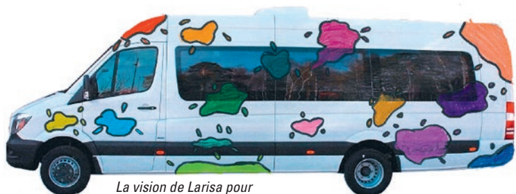
La vision de Larisa pour le nouveau bus scolaire

Pour profiter du talent créatif des élèves, un concours a été lancé auprès de 11 classes du collège de Verdeaux afin d'imaginer la décoration du nouveau carrosse. Sur 200 propositions, toutes plus originales les unes que les autres, c'est le dessin de Larisa, élève de 7P, qui a remporté l'adhésion unanime du jury.