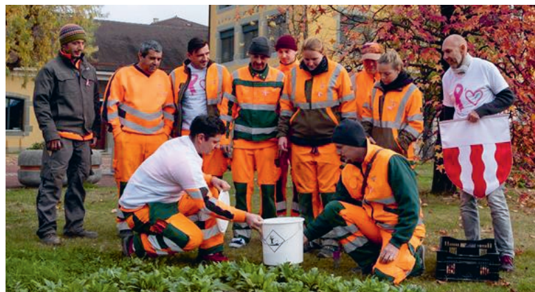
Les collaborateurs des Espaces verts lors de la plantation des 750 bulbes