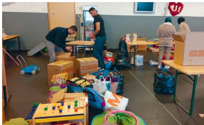
Tri des dons collectés par les jeunes et les élèves de l'établissement secondaire de Renens

Association CTS – 078 773 73 90 contact@association-cts.ch – CCP 12-644 799-3. •