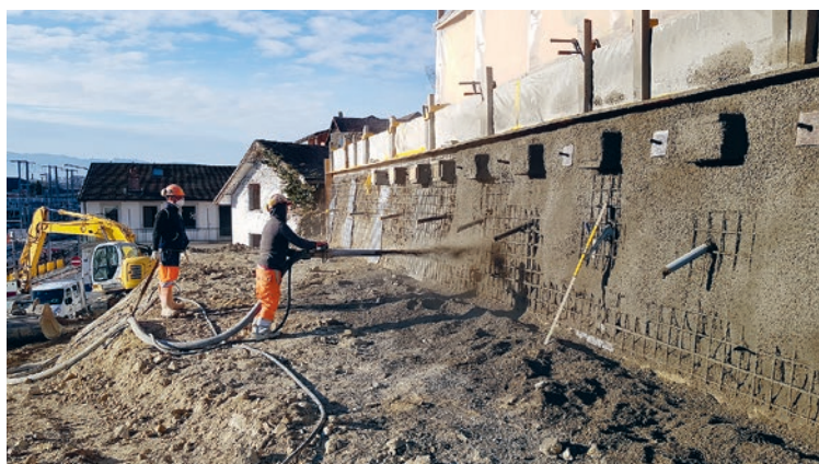
Construction du mur de soutènement (février 2019)

Les travaux de déviation des réseaux souterrains continueront jusqu'en août prochain. •