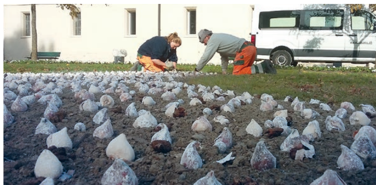
Les 6'000 bulbes ont été plantés en octobre dernier

Cette année, la Ville de Renens a le privilège d'être l'hôte d'honneur de cette 49 e édition