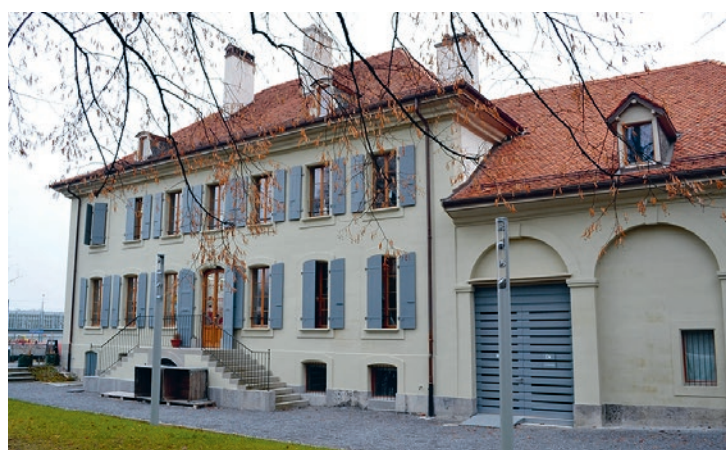
Façade est de la Ferme des Tilleuls

de même que bon nombre des bâtiments construits par la Société Coopérative d'Habitation de Renens et environs ( SCHR ), qui est un des grands acteurs immobiliers de Renens. Il est également à relever que notre commune est impliquée dans 4 PPE, dont une qu'elle préside. Nous gérons également tous les baux à loyer des surfaces nous appartenant, ainsi que les places de parc sises sur les parkings communaux. La politique d'acquisition, de gestion et de ventes éventuelles de parcelles est discutée au sein de la Commission des Affaires immobilières.