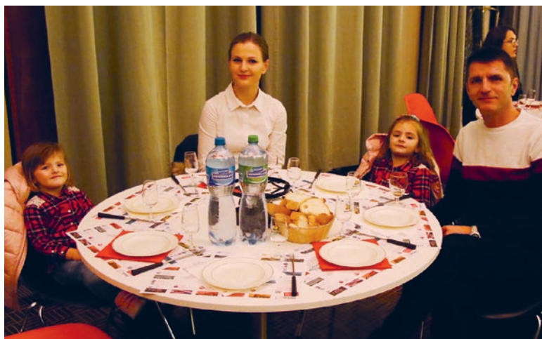
La famille Elezi

Découvrez plus de photos sur notre page Facebook/Ville de Renens. ●