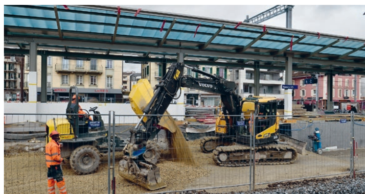
Travaux sur la future voie 4

Les voyageurs seront invités à consulter les écrans d'affichage afin de vérifier de quel quai partira leur train. Par ailleurs, les escaliers provisoires situés à l'est (côté Lausanne) donnant accès au quai 2 seront mis hors service à partir du 7 avril. L'ascenseur provisoire restera quant à lui opérationnel. Une signalétique sera mise en place en conséquence. Ces travaux anticipés permettront de tenir le calendrier serré de transformation de la gare de Renens. •