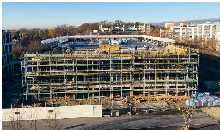
Léman-Maurabia: Reconstruction de la salle de gymnastique et création de nouvelles classes sur le site du Léman