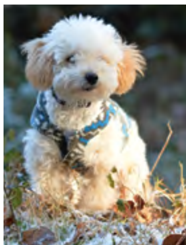
Mirabelle, née en 2018, a été inscrite!

Renseignements et inscription au guichet du Greffe municipal, rue de Lausanne 33, par téléphone au 021 632 71 22 ou par internet www.renens.ch > Guichet virtuel. ●