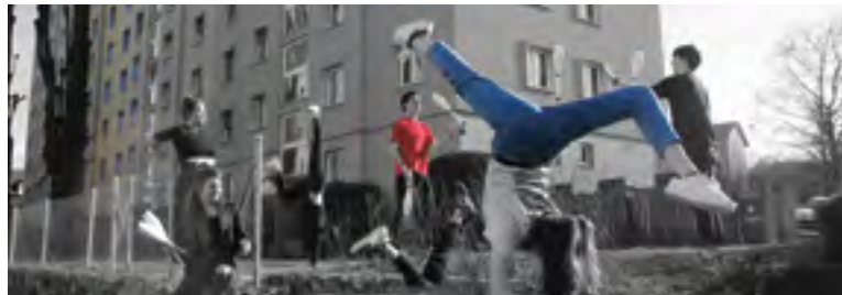
L'Ecole de cirque, le FC Renens et les Cheerleaders figurent parmi les sociétés soutenues par la Ville

Cela signifie qu'en 2018, 13 clubs sportifs se sont partagés la coquette somme de CHF 81'500.-, qui leur a notamment permis de développer des activités pour plus de 1'600 juniors de 4 à 20 ans, dont 583 sont domiciliés sur la commune de Renens.