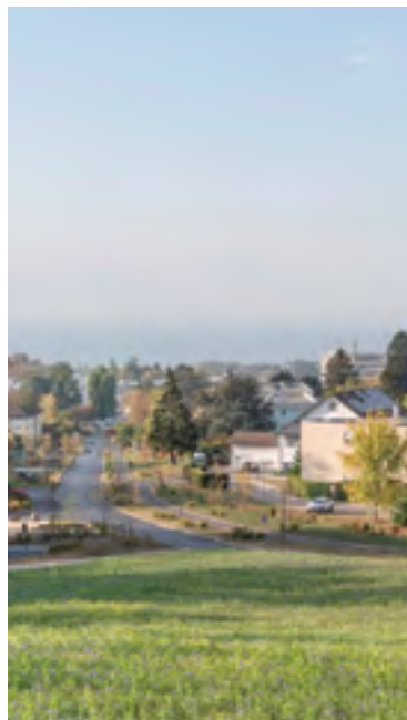
Brume sur le lac vue depuis la piscine de Prilly

Les remarques reçues seront évaluées et recevront une réponse dans le rapport de consultation. •