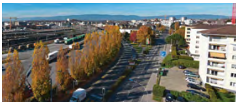
Les peupliers seront conservés sur une partie de la rue de Lausanne

Les 33 sujets abattus seront tous remplacés par une essence à définir, le long du futur sentier pédestre qui sera réalisé dans le cadre des aménagements du tram. ●