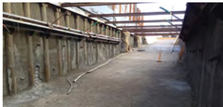
Future rampe d'accès à la halte Prilly-Malley

Initiés en avril 2018, les travaux ont tout d'abord permis de réaliser le trou pour le passage et continuent selon le calendrier. L'ouvrage sera terminé pour l'ouverture des Jeux Olympiques de la Jeunesse en janvier 2020. ●