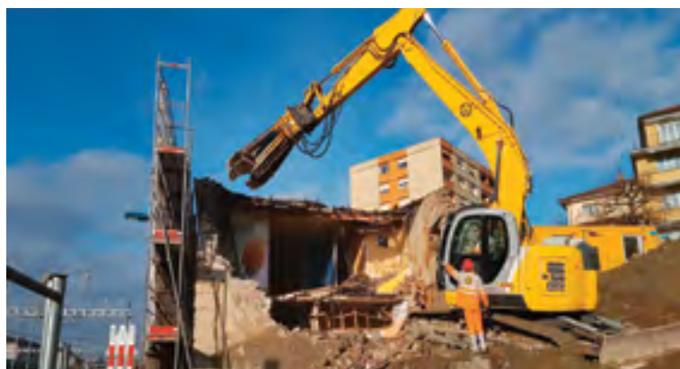
Démolition du bâtiment du Terminus

Les travaux de déviation des réseaux souterrains (eaux claires, eaux usées, électricité, Swisscom, gaz, service de l'eau,...) pour cette 1 re étape continueront jusqu'en juillet prochain.