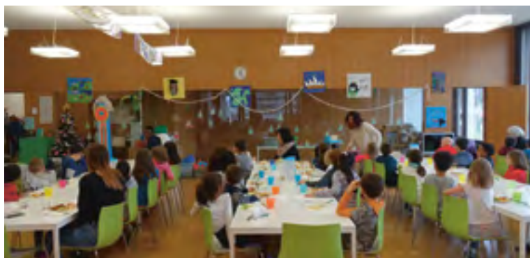
Renens compte 3 unités d'accueil pour écoliers (UAPE), 2 lieux d'accueil en milieu scolaire (APEMS, dont celui du Léman, en photo ci-dessus), 1 réfectoire et 1 espace-repas.

La Municipalité de Renens a pris connaissance du nouveau cadre de référence élaboré par l'EIAP (Etablissement intercommunal pour l'accueil parascolaire), lequel propose notamment l'assouplissement des normes relatives à l'encadrement des enfants (augmentation du nombre d'enfants par professionnelle, diminution du personnel formé, etc.). Impliquée dans la procédure de consultation, la Municipalité a proposé divers ajustements, en particulier le maintien du taux d'encadrement pratiqué jusqu'alors. L'objectif est de conserver des conditions favorables à la réalisation des missions éducative, sociale et préventive de l'accueil parascolaire.