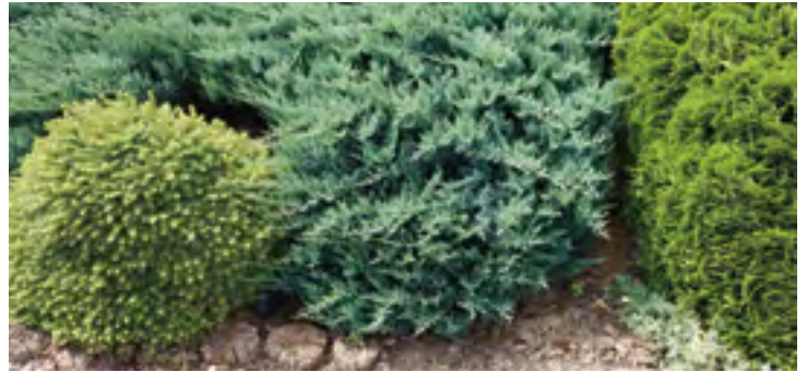
Choisissez par exemple un Juniperus horizontalis Blue Chip

Le choix de ce type de végétaux peut se révéler très judicieux, puisqu'ils ne nécessitent pas d'entretien et ne sont pas ou très peu sujets aux maladies.