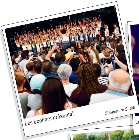
Les écoliers présents!

Le monde entier tenait sur la surface d'un terrain de football en ce début d'été à Renens, une fois n'est pas coutume non pas pour célébrer le ballon rond, mais plutôt pour partager le moment délicieux d'être ensemble et de voyager à travers les musiques et les cultures: folk, pop, world-music, rap, reggae, bossa, afro-funk, création originale, danses, chorale scolaire ou rap symphonique. 12'000 personnes ont assisté aux seize spectacles qui se sont succédé sans transition sur les deux scènes de Verdeaux. Autant de moments de purs bonheurs qui ne demanderont qu'à se renouveler lors du prochain Festimixx 2021. Bravo et merci au public, aux artistes, aux bénévoles et aux organisateurs de cette splendide édition du festival de Renens!