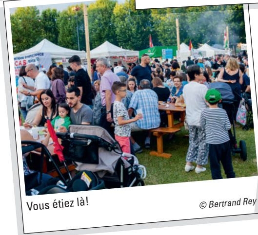
Vous étiez là!