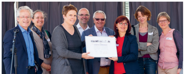
Remise du label «Commune en santé» à la Municipalité in corpore