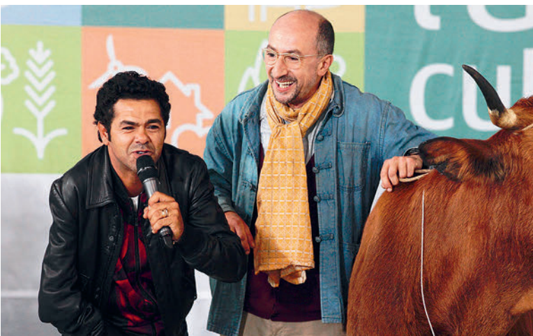
«La Vache», de Mohamed Hamidi, comédie (France, 2016, 91 min., 6/8 ans)