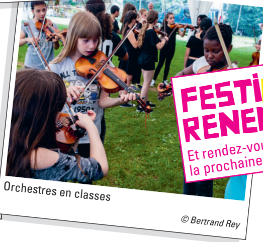
Orchestres en classes