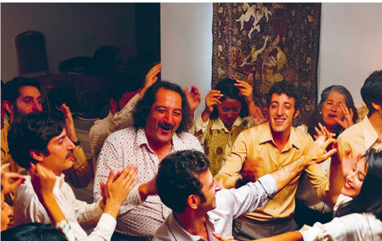
«Nous Trois ou Rien», de Kheiron, comédie dramatique (France, 2015, 102 min., 10/14 ans)

Judi 23 et vendredi 24 août 2018 - 21h, entrée libre Infos: renens.ch