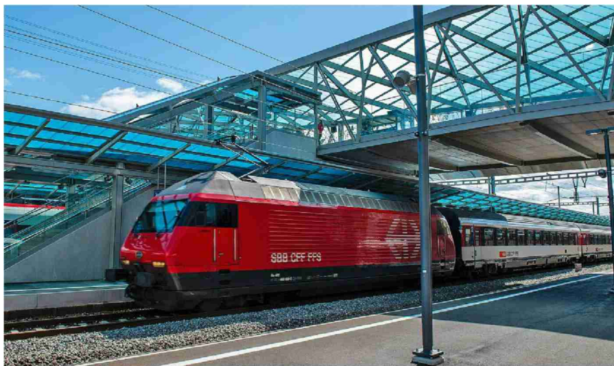
La nouvelle passerelle (à g.) vient compléter la réfection de l'ancien passage sous-voies (à dr. en 2007), effectuée il y a quatre ans. VANESSA CARDOSO/PHILIPPE MAEDER

L'axe ferroviaire En construction entre Prilly-Malley et Renens, le saut-de-mouton doit être achevé en 2022, de même que les travaux pour la création d'une quatrième voie entre Lausanne et Renens. C.DN