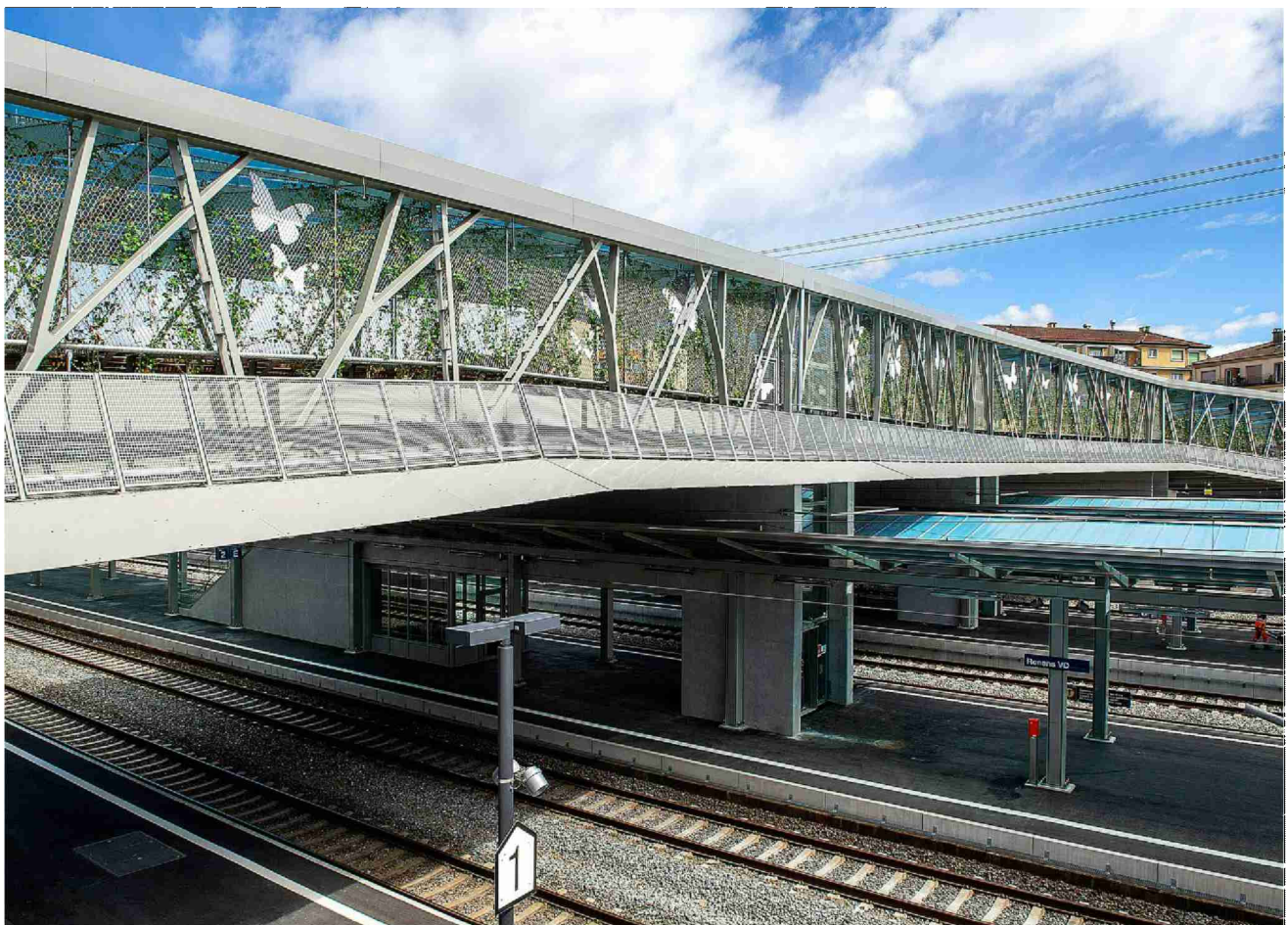
Infrastructures Le «Rayon vert», arborisé, enjambe les voies de la troisième gare de Suisse romande. |