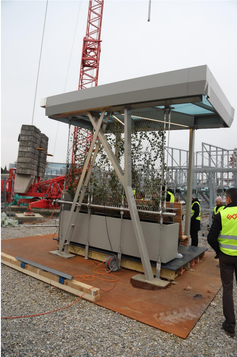
vue arrière des bacs à fleurs