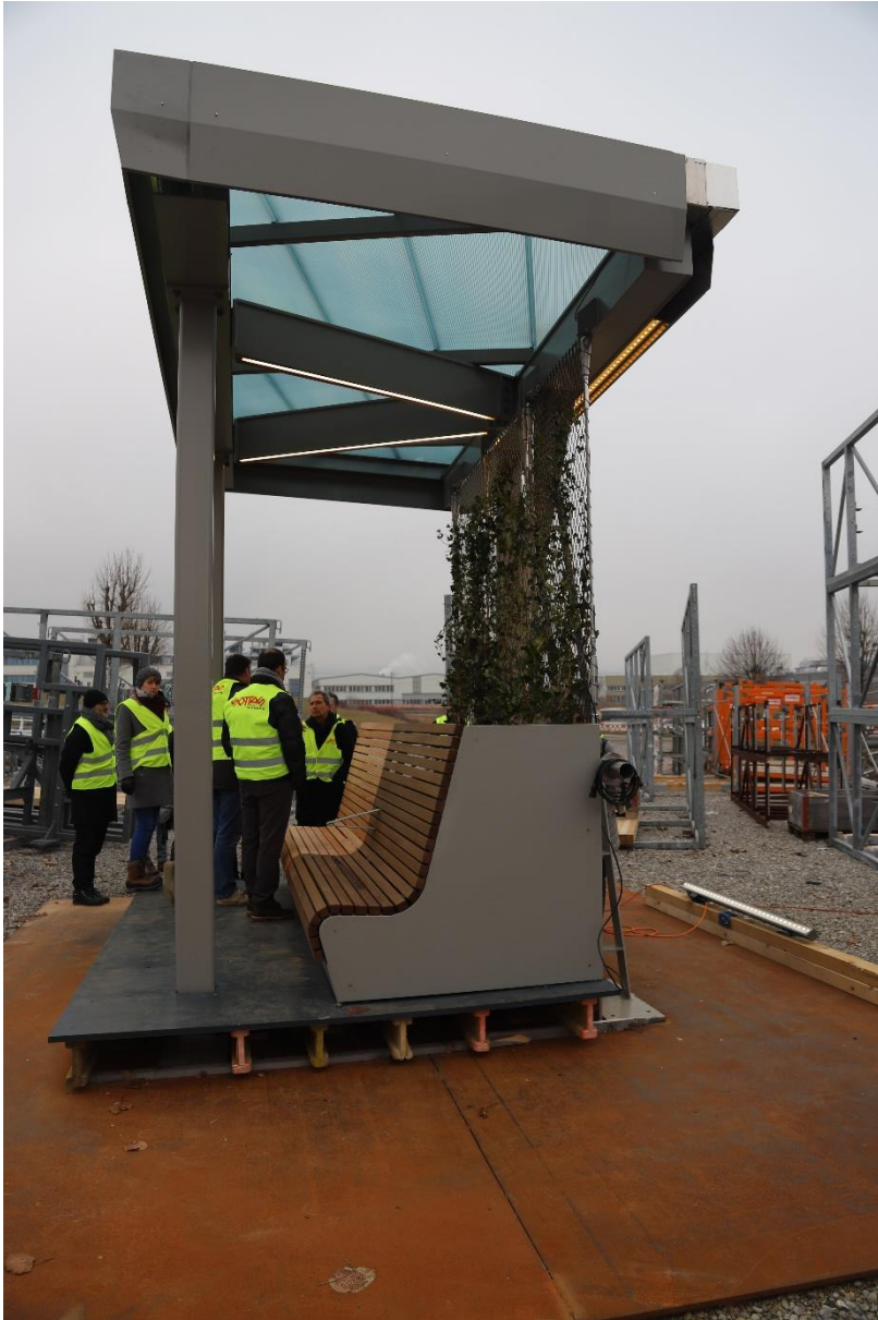
Le banc et son assise