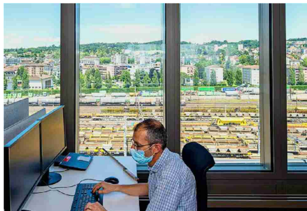
Depuis les étages, la vue sur le lac ferroviaire de la gare de triage est imprenable.