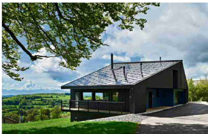
Sur cette maison conçue par le bureau Lutz Architectes, des panneaux solaires d'apparence ardoise s'intègrent harmonieusement dans le paysage du Jura vaudois.