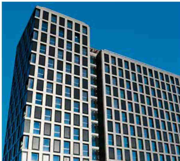
A Renens, la résidence universitaire Silo Bleu se dresse en échiquier futuriste.