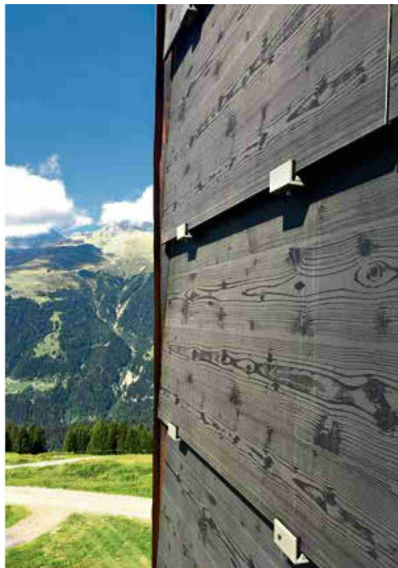
Les panneaux photovoltaïques imitant le bois sur la façade du restaurant Chäserstatt, à Ernen (VS).

INNOVATION Exit le dispositif photovoltaïque lourd et encombrant: grâce à des technologies de pointe, les panneaux solaires se déguisent en verrières colorées, en ardoise élégante, en terre cuite ou en bois veiné