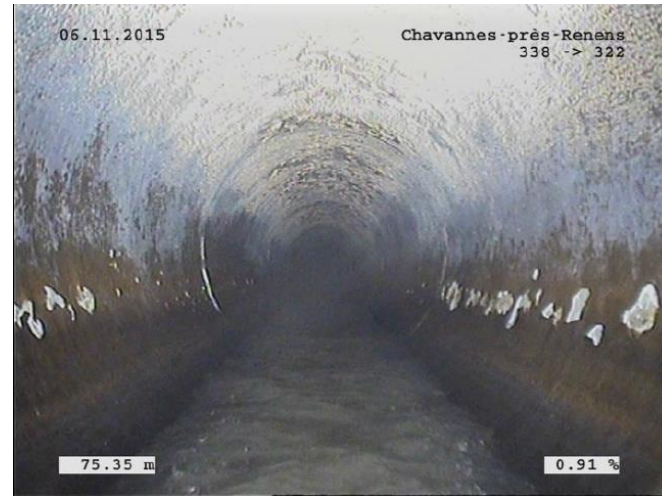
Dégradation de la paroi de la canalisation