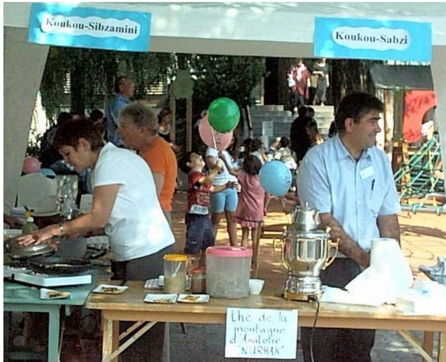
Les cuisinières et cuisinier du Samedi de la CISE en pleine action

Des stands différents ont proposé des informations sur leurs activités et ont animé la matinée notamment par un jeu d'écriture, la confection en direct de deux recettes iraniennes et d'un thé anatolien (photos ci-dessous) ou la mise à disposition de bandes dessinées en plusieurs langues (photo de couverture).