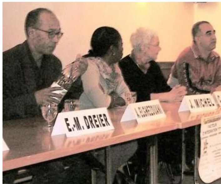
Quelques intervenants de la conférence du 29 janvier

Organisée par la CISE et son groupe « Conférence » à la buvette de la salle de spectacles, cette conférence a permis de donner la parole à plusieurs personnes naturalisées sur leurs motivations et leurs expériences. En dehors des discussions légales ou politiques sur la naturalisation, elle a permis d'échanger sur la difficulté et les richesses de la double appartenance et sur le rythme individuel et parfois différent d'une telle démarche. Elle a réuni l'intérêt d'env. 80 personnes et a permis à deux collaborateurs de l'association Appartenances d'apporter leur éclairage sur la question.