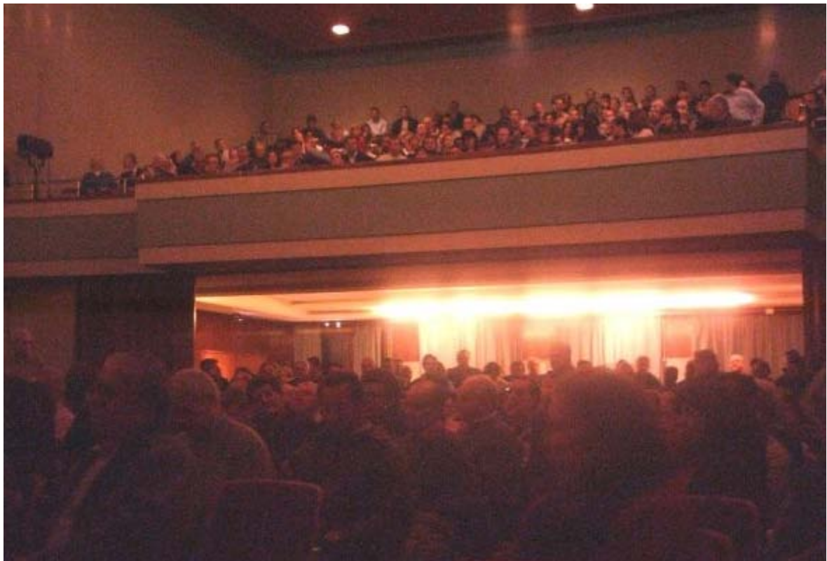
Aperçu de la salle de spectacles, comble, le soir du 21 janvier 2004

Cette soirée a touché tous les participants et était empreinte d'une grande émotion. Un CD a été réalisé avec l'ensemble des reportages effectués à cette occasion et peut être prêté par la CISE.