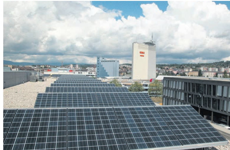
Les panneaux solaires installés sur le toit du bâtiment Vaudaire de l'établissement scolaire du Léman

Au niveau de la gestion du parc immobilier communal, la construction de nouvelles écoles permet de contrebalancer des bâtiments locatifs et administratifs souvent vieillissant et déficient au niveau énergétique, nécessitant un véritable choix politique quant à son avenir.