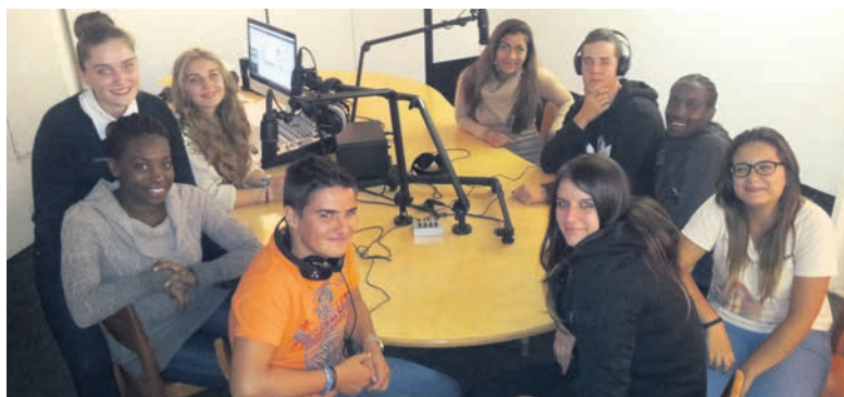
L'équipe qui animera les émissions du 21 au 25 octobre

Du 21 au 26 octobre un groupe de jeunes réalisera une émission radio quotidienne diffusée sur internet. A l'antenne, les jeunes susciteront le débat sur les nouveaux médias et encourageront leurs auditeurs à en faire autant.