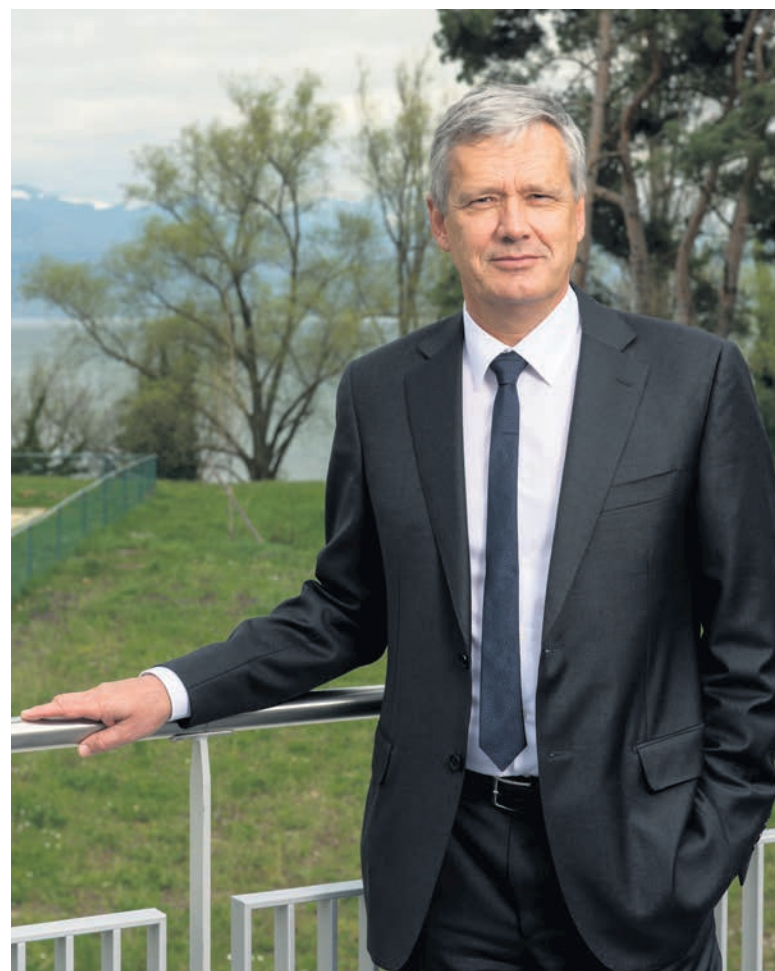
Dominique Arlettaz, Recteur de l'UNIL