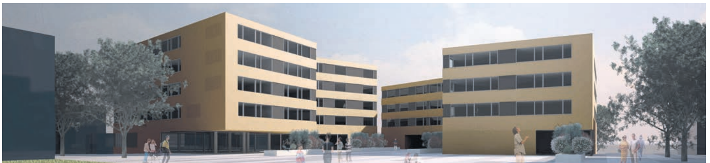
Image de synthèse du futur gymnase

La mise à l'enquête du plan de quartier des Entrepôts dont l'élément phare est sans conteste le Centre d'enseignement postobligatoire de l'Ouest lausannois (CEOL), qui accueillera le premier gymnase du District, a rencontré un accueil positif.