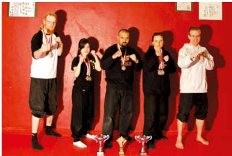
Les médaillés du Cercle du Dragon

Résultats complets et informations: www.cercle-du-dragon.com