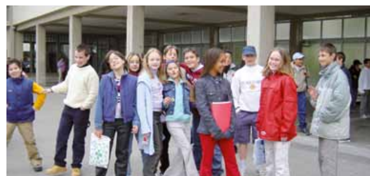
Récréation au Collège de Verdeaux

Le Conseil se réunit au minimum 4 fois par année et travaille actuellement sur des dossiers tels que la sécurité sur le chemin de l'école ou encore l'aménagement des préaux. Ses séances sont publiques et annoncées sur le site de la Ville de Renens: www.renens.ch rubrique «Ecoles». ●