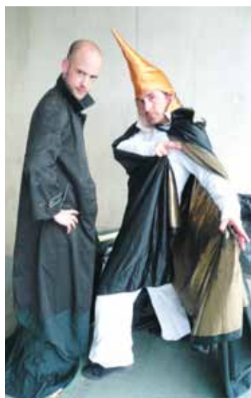
Les Batteurs de pavés

Après Transit en 2009, voici Transit bis, le 2 ème volet du programme spécial de renforcement des animations au Centre-ville consacré aux arts de la rue. Place aux jongleurs, échassiers, cracheurs de feu, cirque de poche et autres saltimbanques!