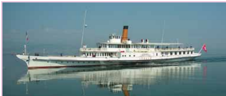
Le bateau «L'Italie»

Nouveau! Vous avez également la possibilité d'effectuer votre paiement par cartes: Maestro ou PostFinance Direct. ●