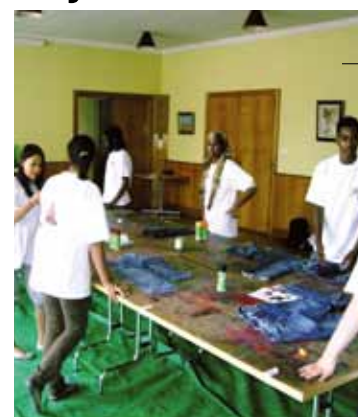
Atelier «Je relooke mon style»

Du 5 au 18 juillet ou du 2 au 15 août. Un seul passeport est délivré par enfant. ●