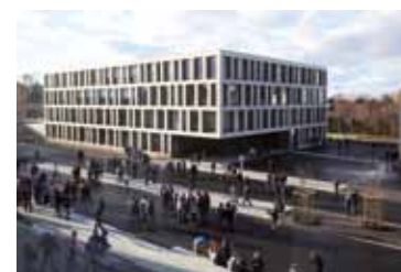
Le Collège du Léman - © Paysagegestion

ludiques seront offertes aux visiteurs sans oublier les traditionnels stands de boissons et gourmandises. Pour souligner l'importance de l'événement, le «Radio Bus» de la Haute Ecole Pédagogique émettra un programme sur place et spécialement conçu par des élèves à l'occasion d'une journée qui promet de rester dans les annales. ●