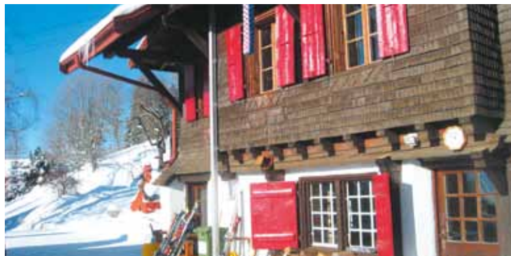
Le chalet Joli-Bois d'Ondallaz

Un petit étourdi qui avait quitté l'école de ski des Pléiades pour suivre le groupe par inadvertance jusqu'au chalet! Si le conte d'Alice au pays des merveilles n'avait pas existé, Ondallaz l'aurait inventé. ●