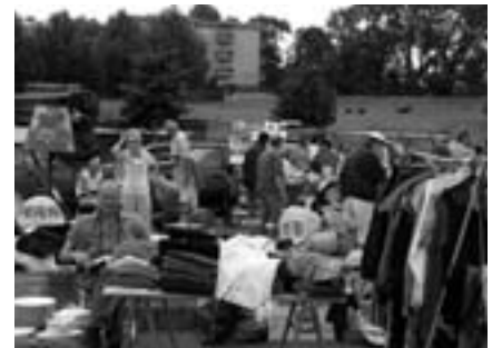
27 août: 1 er vide-grenier organisé à Renens, au Centre Technique Communal. Une prochaine édition est d'ores et déjà programmée pour le samedi 8 avril 2006