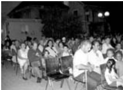
1 er juillet: Festival de Théâtre en Herbe sur la Place du Marché décorée par les élèves-artistes de la Ryan International School de New-Delhi