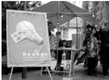
21 mai: Stand «J'ai une idée» sur la Place du Marché

P.S.: Pour toi tout spécialement, quelques photos souvenirs de Renens 2005