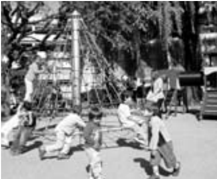
Cortège de la Fête du printemps et ouverture officielle des animations sur la Place du Marché