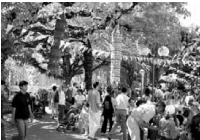
11 juin: Festival de Théâtre en Herbe sur la Place du Marché décorée par les élèves-artistes de la Ryan International School de New-Delhi