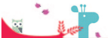
Le logo du projet «1001 histoires»

Lieu: Aux 4 Coins, av. du Censuy 5 à Renens.