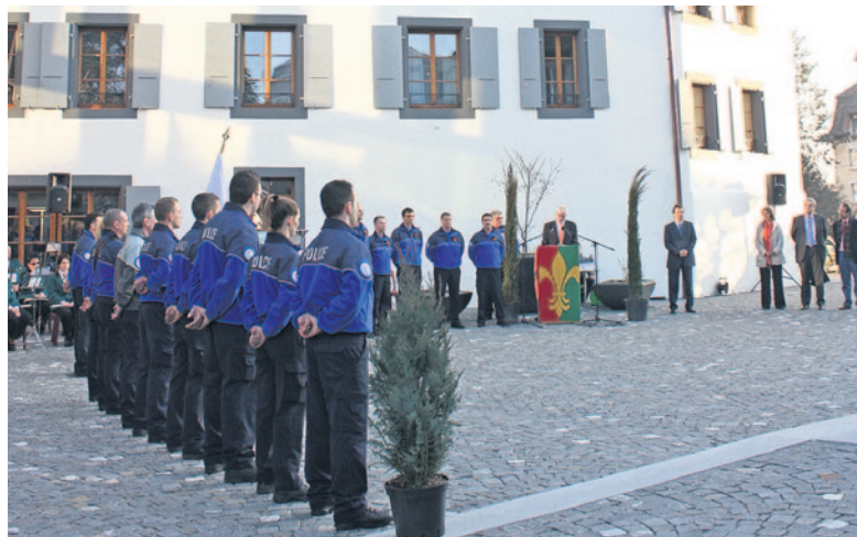
Le moment solennel de la prestation de serment sur la Place du Château à Prilly

Des photos de cette manifestation sont disponibles sur www.polouest.ch . ●