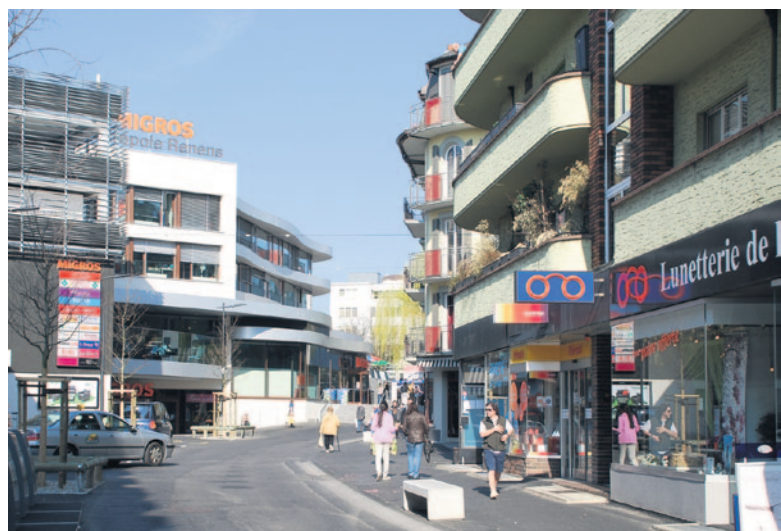
Une vingtaine de commerces sont installés à la rue de la Mèbre

Une façon claire de se soucier des commerces et de reconnaître cette activité comme élément important du tissu économique et de la vie renanaise! ●