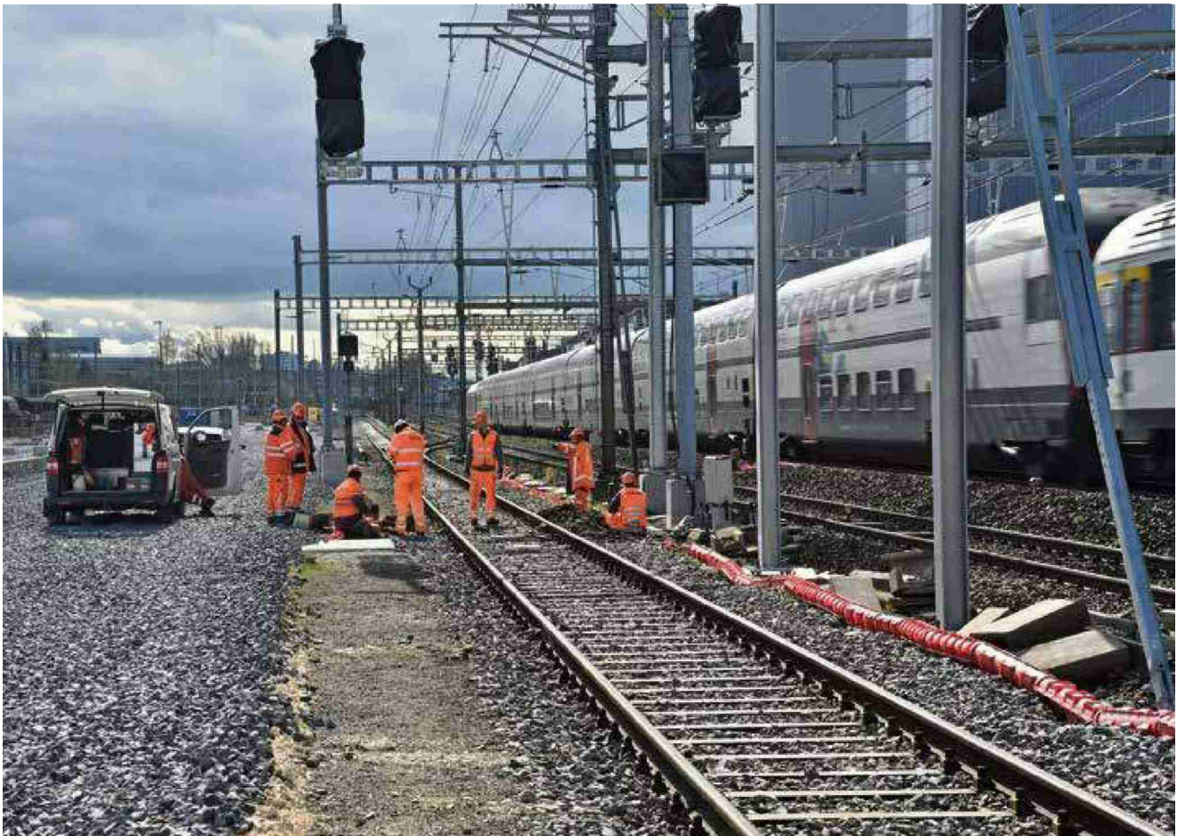
Les multiples chantiers sur la ligne ferroviaire de l'Arc lémanique ont pour but de révolutionner la mobilité d'ici à quelques années.

N° de thème: 862.021 N° d'abonnement: 1094419 Page: 6 Surface: 91'151 mm 2