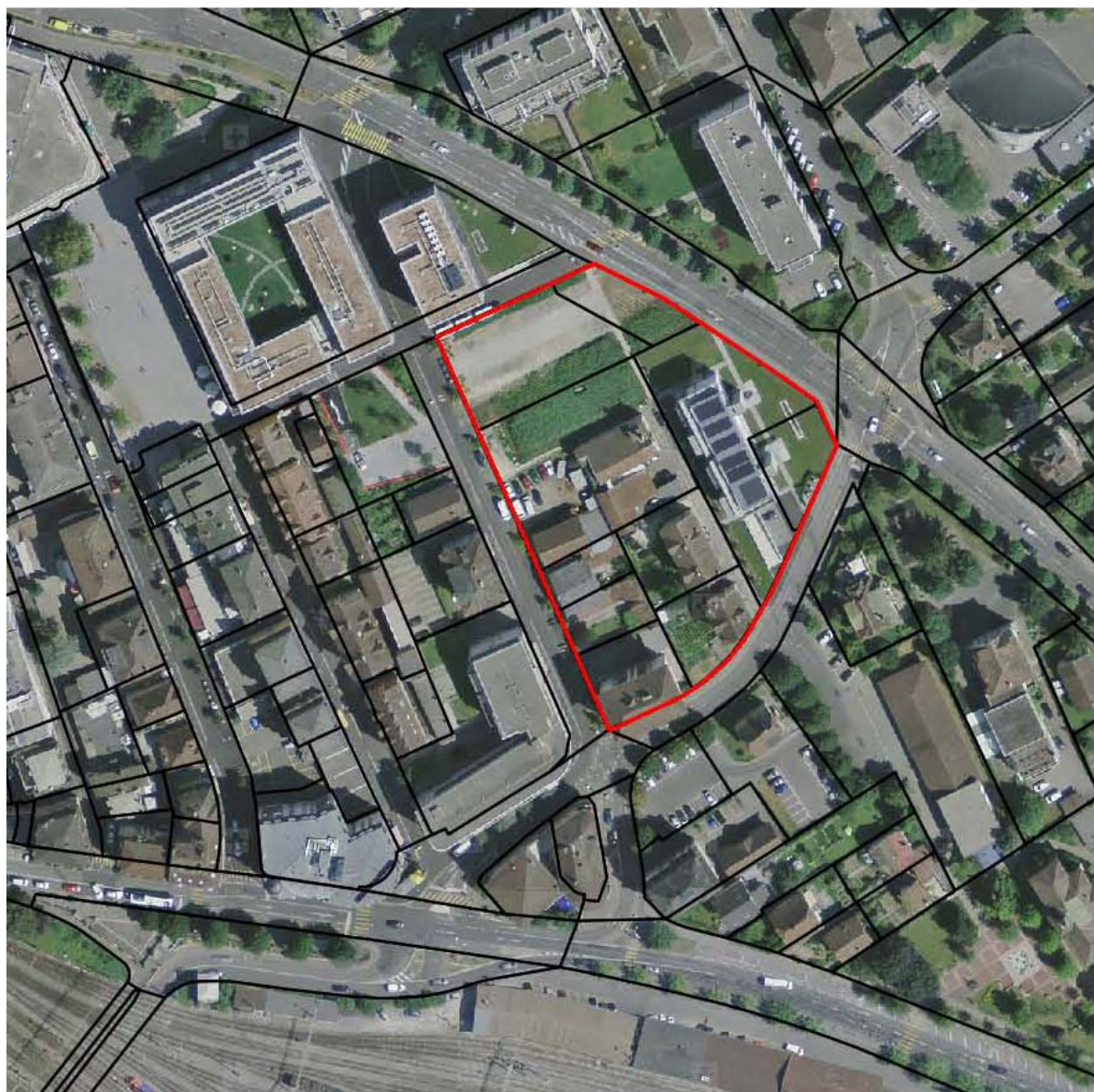
situation, orthophoto, 2015, périmètre ilot de la Savonnerie