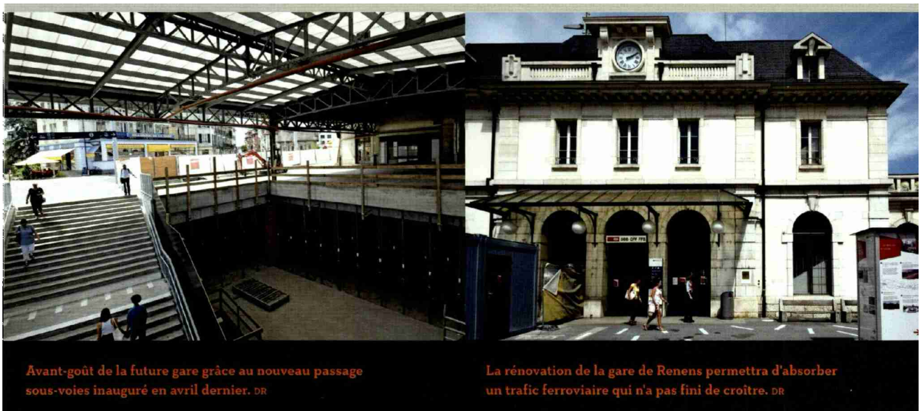
Avant-goût de la future gare grâce au nouveau passage sous-voies inauguré en avril dernier.

et que l'on pourra envisager la fin des travaux... L'Ouest lausannois est un ensemble fort, véritable poumon économique du canton. Il est important que les infrastructures puissent se développer afin de garantir un accueil et une mobilité de qualité pour les entreprises et la population. La rénovation et les différentes améliorations de la gare de Renens permettront de pérenniser la force de l'Ouest lausannois, ainsi que celle de l'ensemble de l'Arc lémanique.